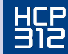
Side load case packer Encaisseuse horizontale

• Vertical carton magazine, easy to load with cases laid flat.